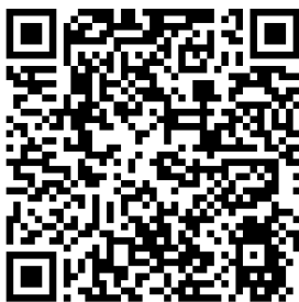
圖 3 ↑ 識別證下載區