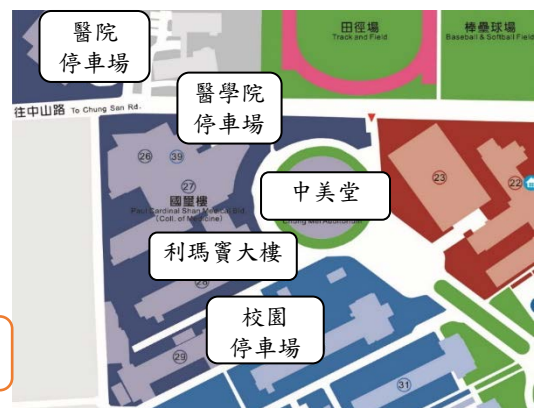
圖 1 → 校園地圖+停車資訊